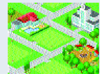
LBS-City: Die virtuelle Stadt, in der Sie jetzt planen können.

Morgens aufwachen und das Grundstück ist weg. Was? Diesmal wollte man doch der Erste sein. Jeden Tag aufs Neue können Sie auf www.LBS-City.de Ihr Haus bauen. Sie müssen nur schnell sein. 25 Grundstücke stehen zur Verfügung. Zunächst rechnen Sie aus, wie viel Haus Sie sich leisten können, dann wird das Haus entsprechend ausgestattet – und schon steht es in der virtuellen Stadt LBS-City. Falls es mal mit dem Grundstück nicht sofort klappt – nicht traurig sein. Im Rathaus können Sie sich die Zeit vertreiben mit Spielen und vielen Infos. Obendrauf verlost die LBS jeden Monat eine 3D-Architektur-Software. Mitmachen lohnt sich also doppelt.