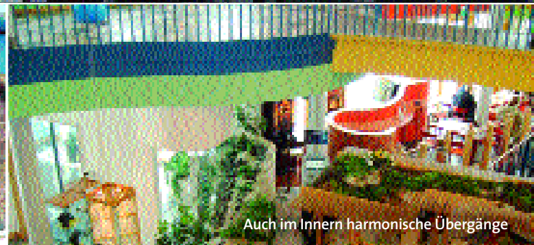
Auch im Innern harmonische Übergänge