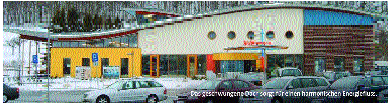
Das geschwungene Dach sorgt für einen harmonischen Energiefluss.

Für die räumliche Umgebung ist es wichtig, dass die Energie – chinesisch: Chi – optimal fließt. Denn dies fördert die Inspiration. Ideal ist, wenn sich dieser Chi-Strom frei und ungehindert von