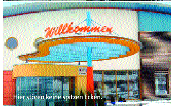
Hier stören keine spitzen Ecken.